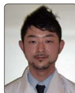
たて けいせい 館 慶生 産婦人科

今回初めて田川市立病院に着任致しました。産科・婦人科全般において地域に根差した医療を行っていきたく考えています。よろしくお願いいたします。